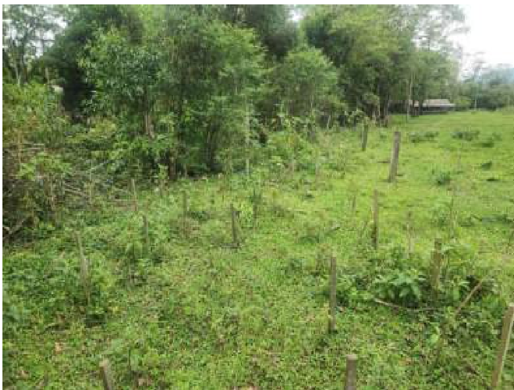
Fig. 25: mudas pequenas com sinal de herbivoria e pisoteamento por gado. A cerca está com arames rompidos em diversos pontos. 14/11/2023