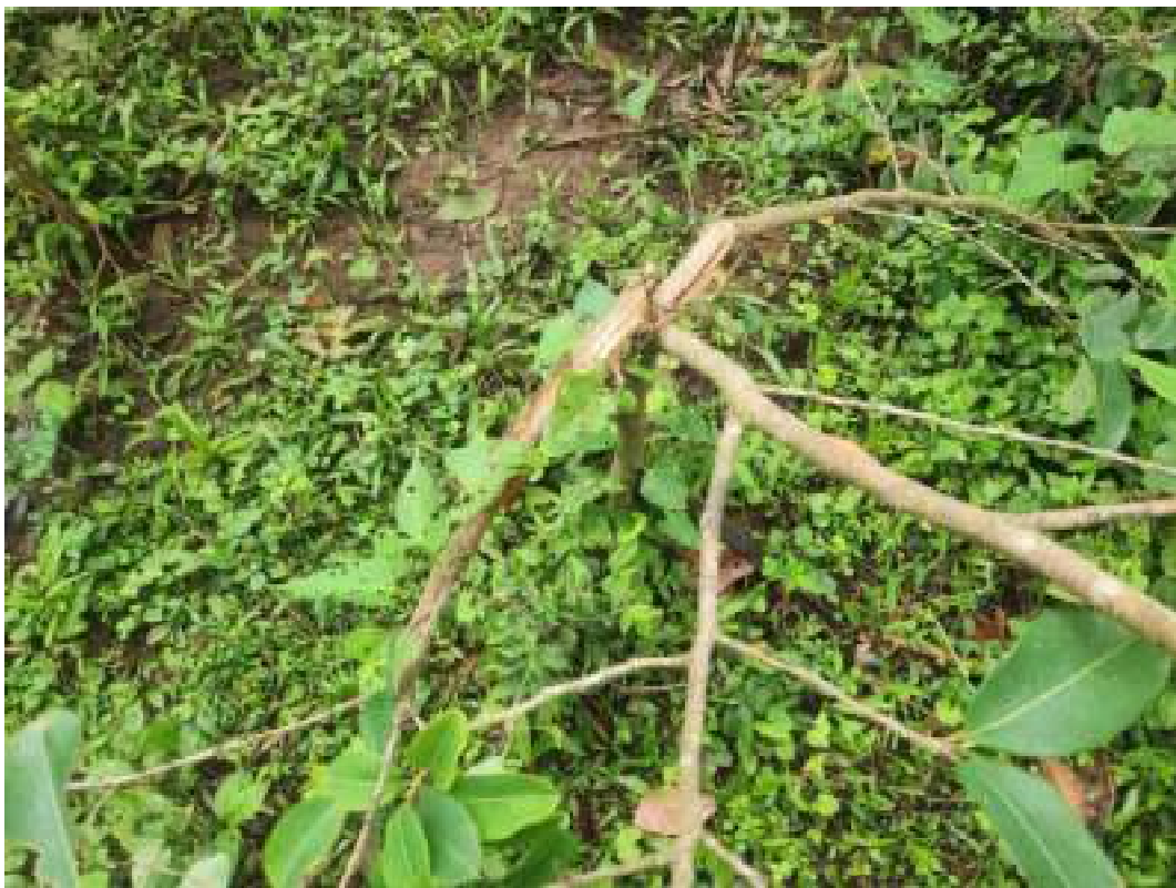
Fig. 17: muda de cocão ( Erythroxylum argentinum ) danificada por gado. 14/11/2023