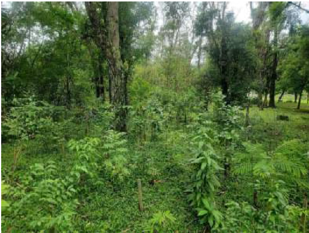
Fig. 13: Aspecto geral da área 1 Mudas com alta taxa de sobrevivência e ótimo crescimento. Sem sinais de presença de gado. 14/11/2023