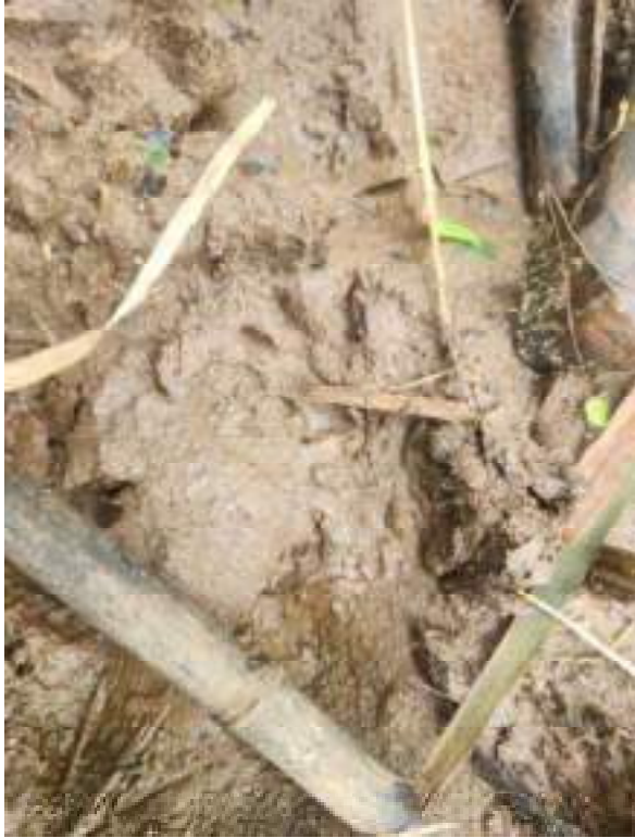
Fig. 12: Rastro de mastofauna, provavelmente mão-pelada ( Procyon cancrivorus ) na área 1. 14/11/2023