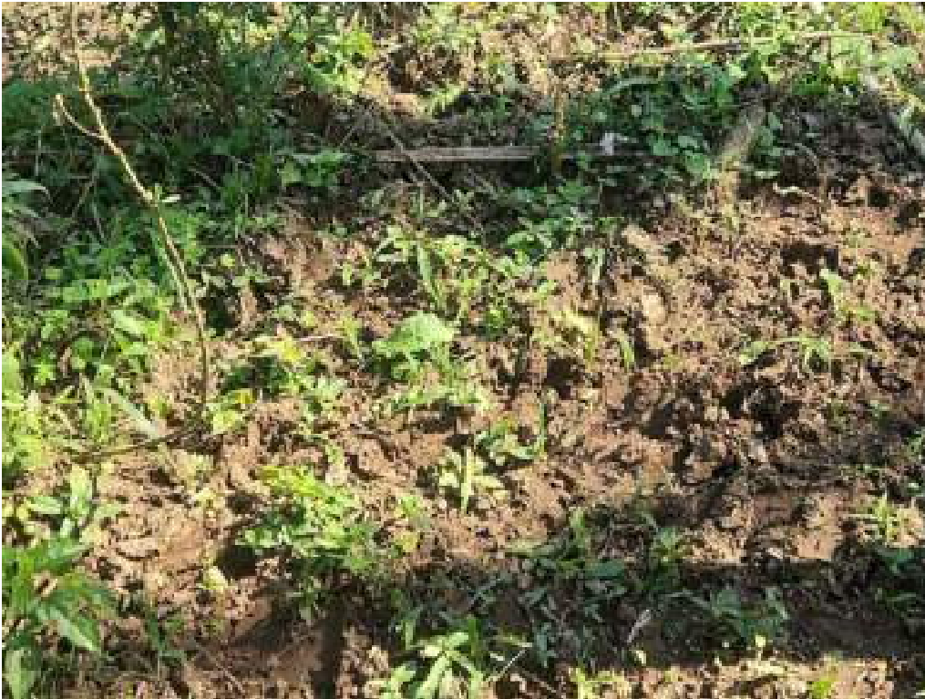
Fig. 18: Rastros e pegadas indicando presença constante de gado na área 2. 23/07/2023