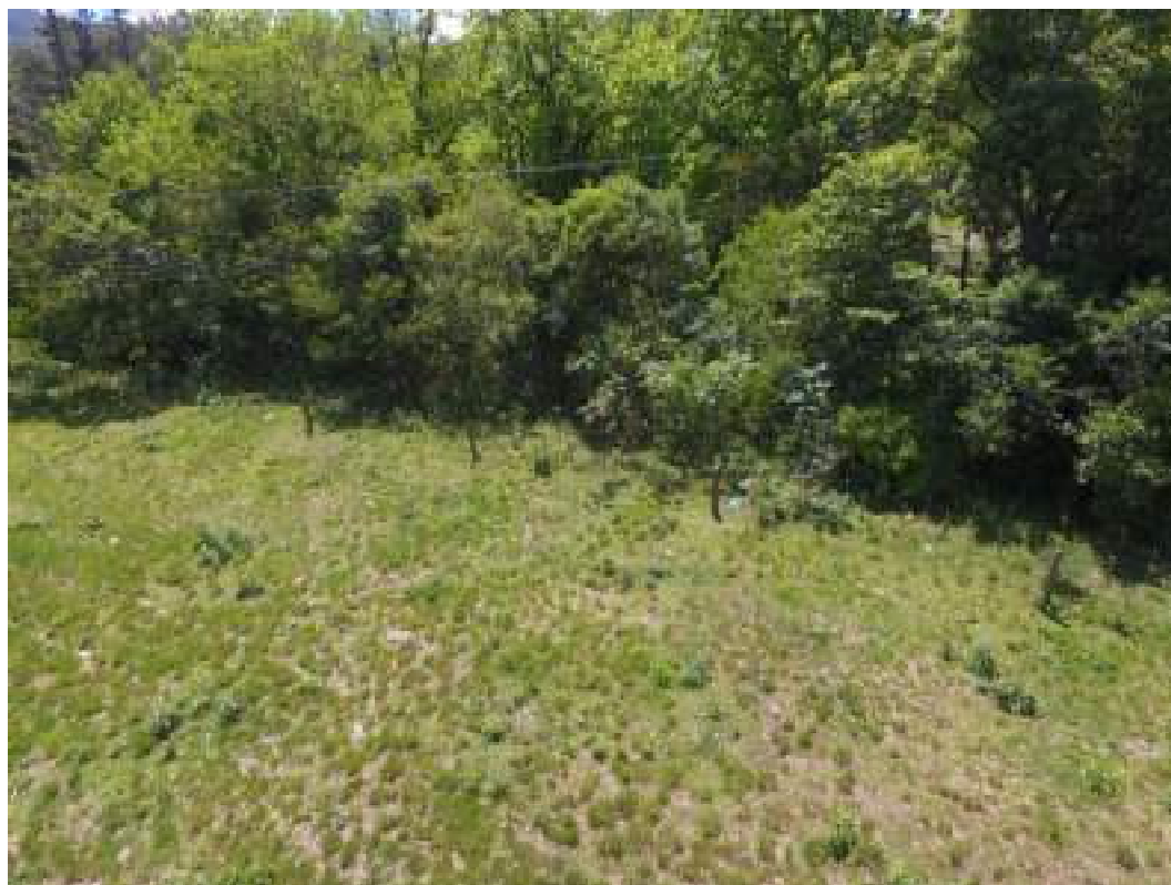
Fig. 20: Imagem aérea do plantio na margem do córrego do lado do CTG DEvotos da Tradição. 25/10/2022

Nesta área a taxa de sobrevivência foi considerada média e a taxa de crescimento considerada baixa . Mudanças com estado sanitário abaixo do esperado e área com poucos sinais de regeneração natural devido à presença de gado.