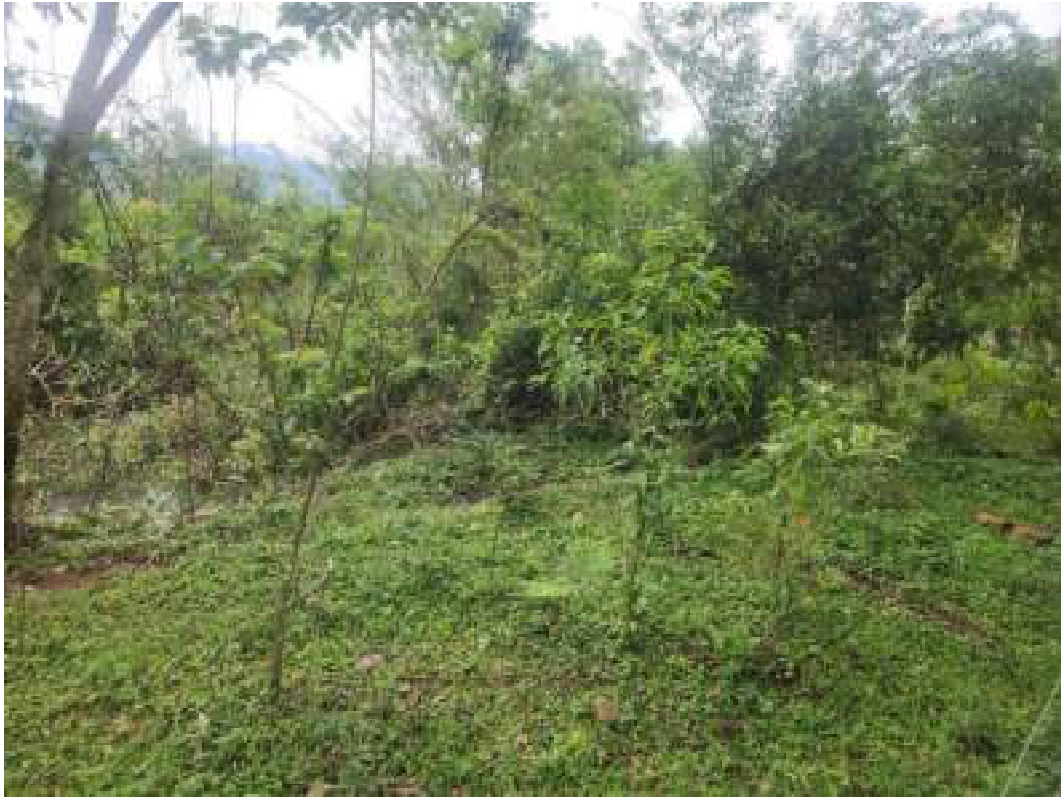
Fig 16: mudas com bom crescimento na área 2. Poucos sinais de pisoteio e herbivoria por gado. 14/11/2023