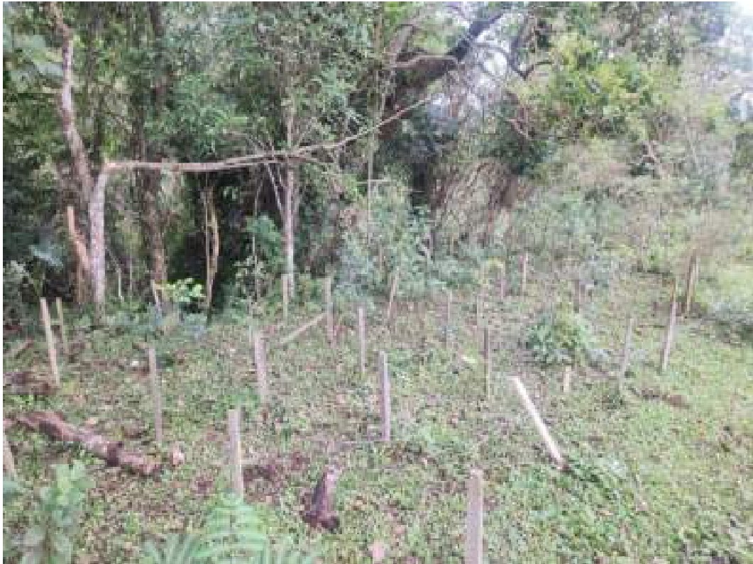
Fig. 21: Aspecto geral da área 3, cerca rompida e mudas com sinal de pisoteamento e herbivoria por gado. 14/11/2023