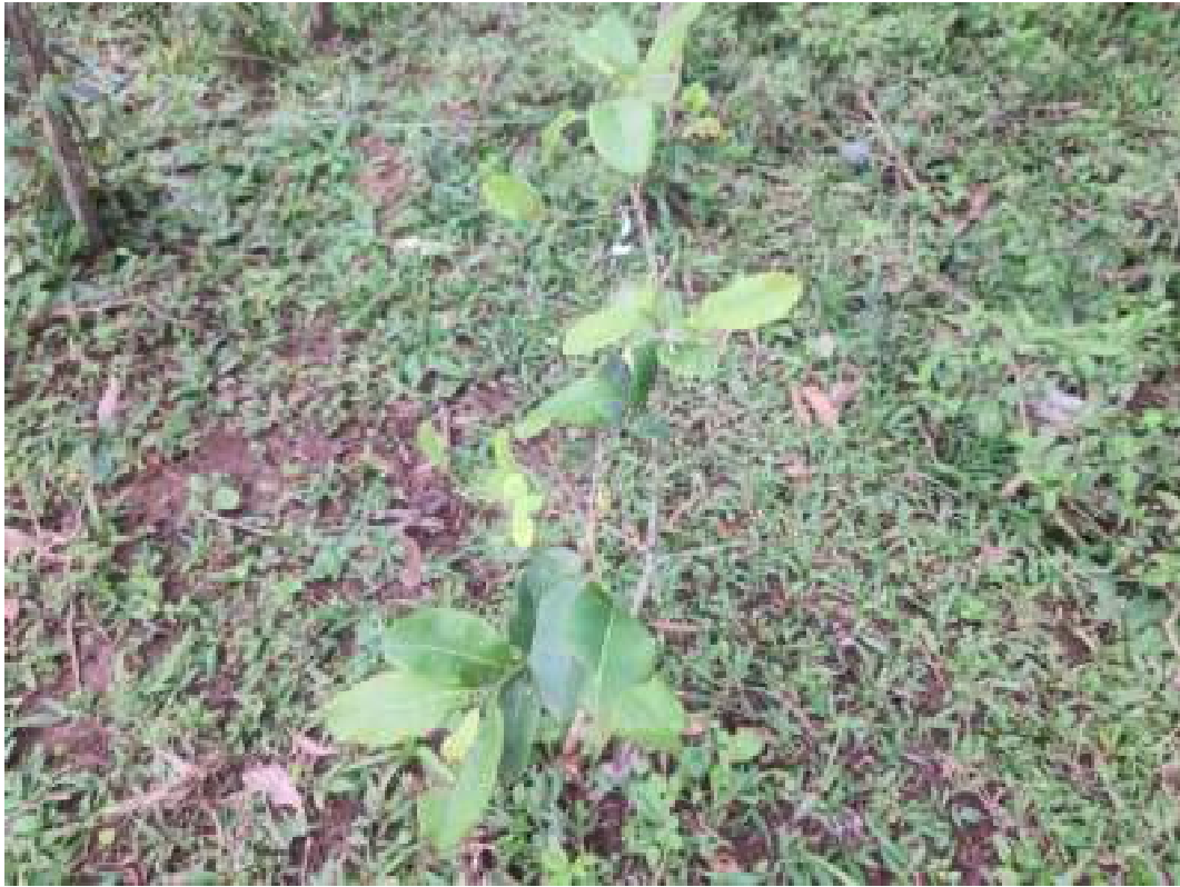
Fig. 23: área 3 Indivíduo de cocão ( Erithroxylum argentinum ). Observa-se marcas de pisoteio por gado ao redor. 14/11/2023