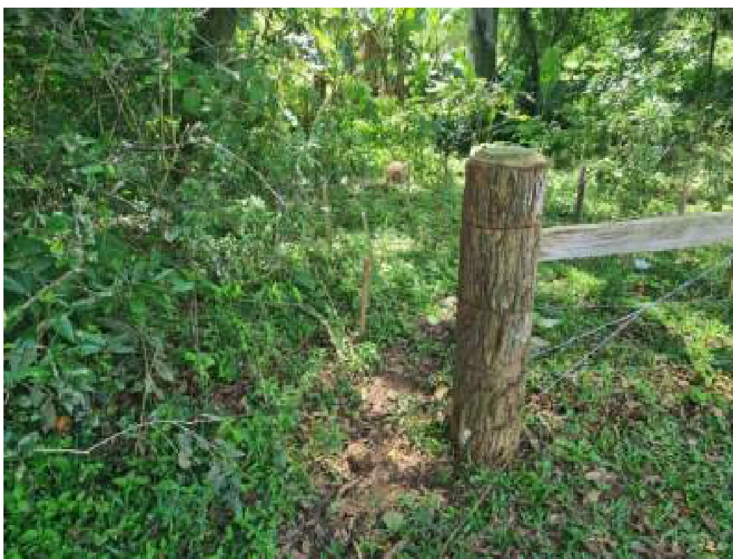
Fig. 26: Abertura na cerca que permite a entrada do gado na área do CTG Devotos da Tradição. 14/11/2023