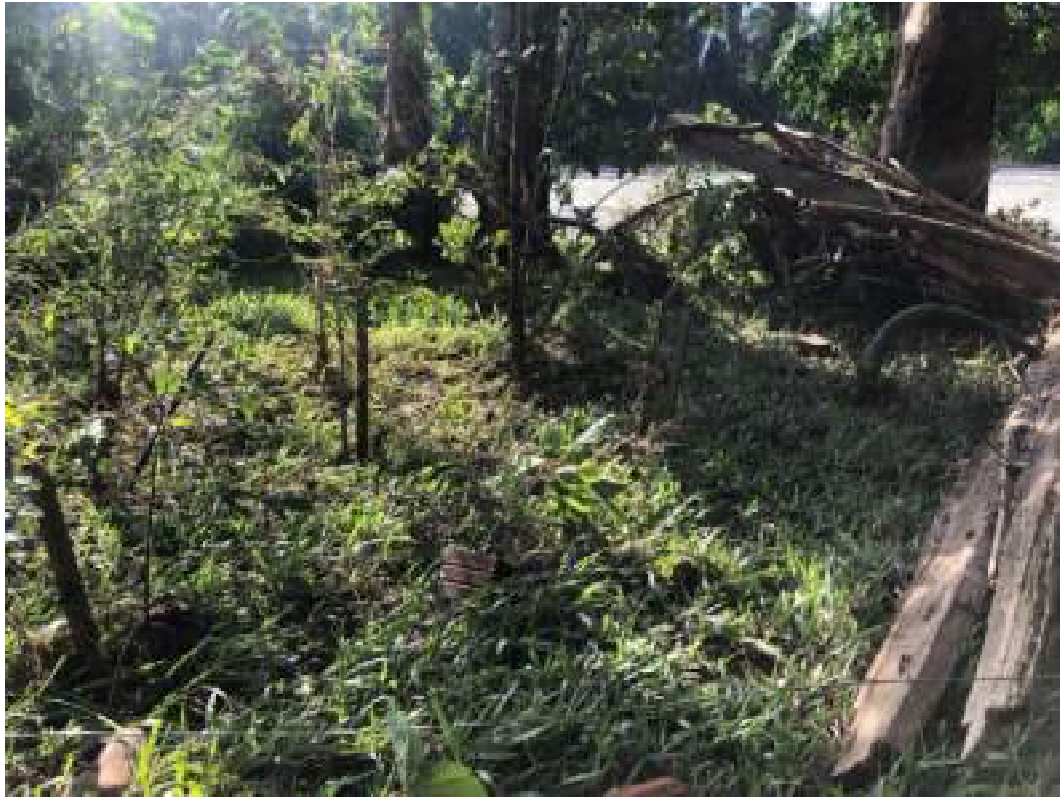
Fig. 8: mesmo com a enchente, as mudas plantadas pela Anama permaneceram enraizadas e com vida, mostrando alta resistência às enxurradas. Balneário Municipal. 18/06/2023