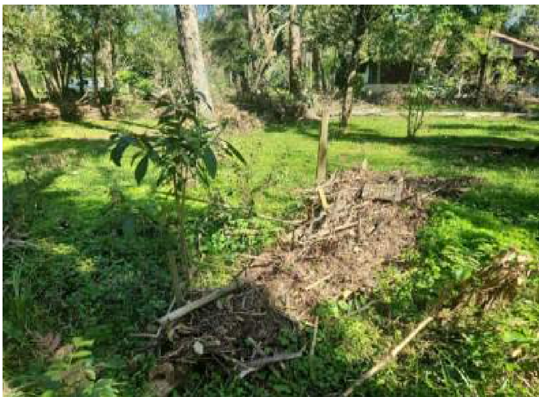
Fig. 5: deposição de muita matéria orgânica e lixo em decorrência do ciclone. Balneário Municipal. 23/07/2023