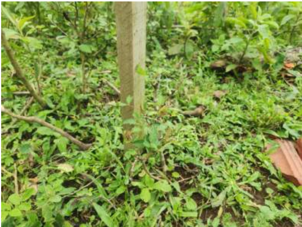
Fig. 24 : Indivíduo de aroeira-vermelha ( Schinus terebinthifolius ) com sinais de herbivoria por gado. 14/11/2023