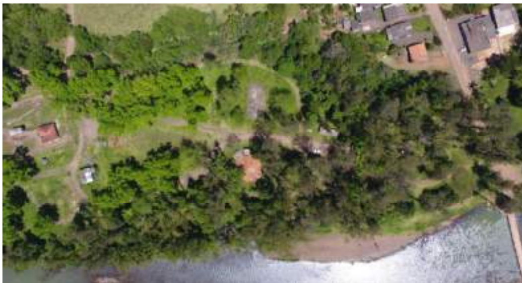
Figura 2: Imagem de drone sobre o Balneário Público Municipal e CTG Devotos da Tradição. 25/out/2022