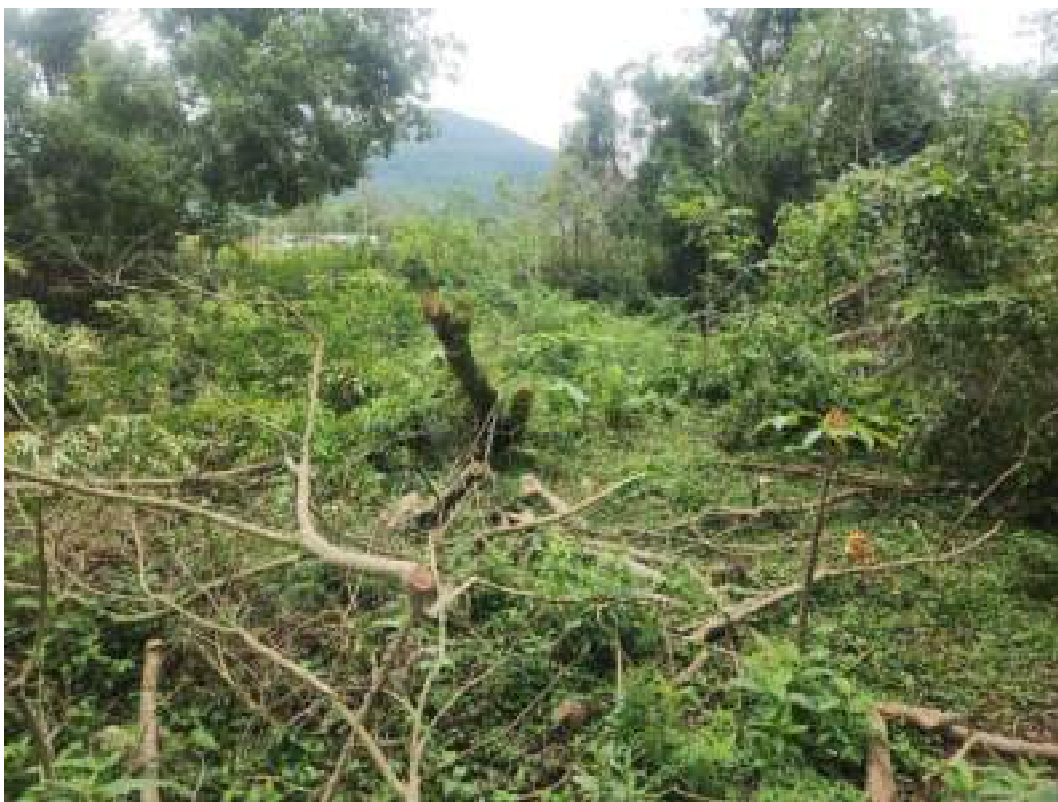
Fig. 15: árvores caídas sobre as mudas em consequência dos fortes ventos causados pelo ciclone de junho de 2023. 18/06/2023