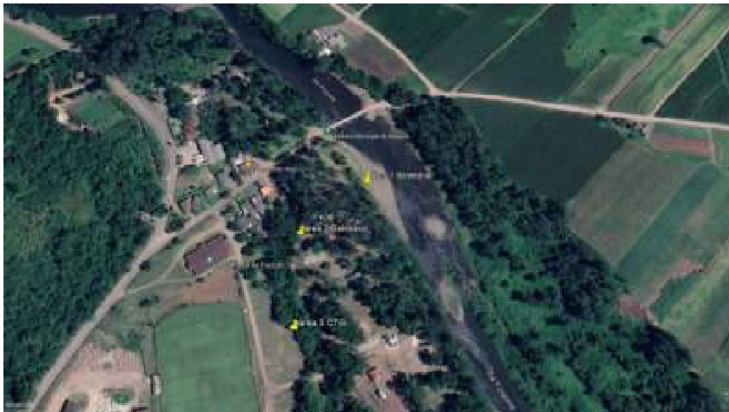
Figura 1: Imagem de satélite Google Earth (28/03/2022), com os locais indicados pela Prefeitura para cumprimento das RFOs e PRAD, no Balneário Público Municipal e CTG Devotos da Tradição

Tradição, contígua a uma das áreas do Balneário (figuras 1 e 2). As 3 áreas são de preservação permanente, uma na margem direita do rio Maquiné e, as outras duas, nas margens de uma pequena drenagem oriunda das encostas da Serra Geral. Desta maneira, no lugar dos 4 Relatórios distintos para as 4 áreas inicialmente previstas no Termo de Parceria, ajustou-se para este que contempla todas as 3 áreas definidas no Balneário e CTG.