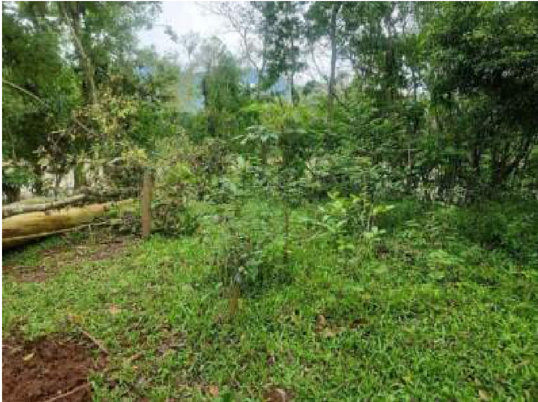
Fig. 10 : Aspecto geral da área 1. Mudanças com alta taxa de sobrevivência e ótimo crescimento. Sem sinais de presença de gado. 14/11/2023