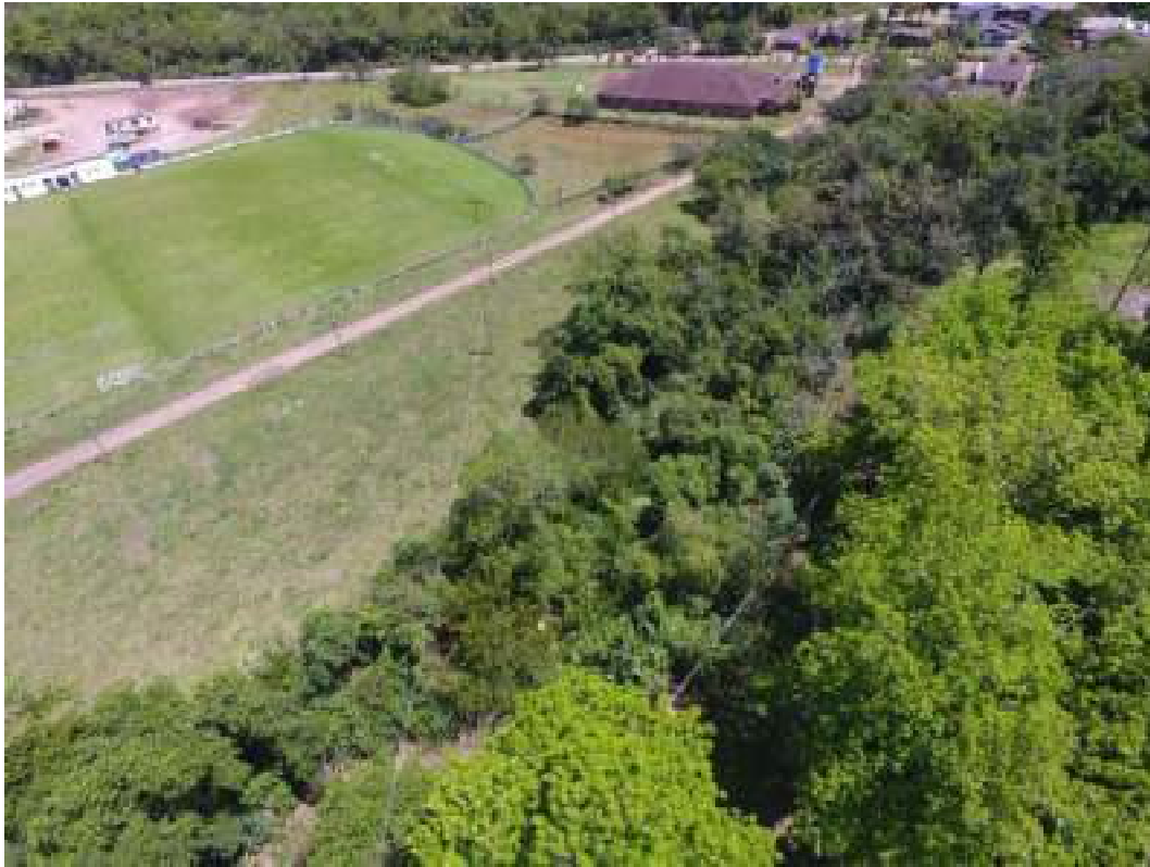
Fig. 14: Imagem aérea do córrego que delimita as áreas do Balneário e do CTG Devotos da Tradição. 25/10/2022