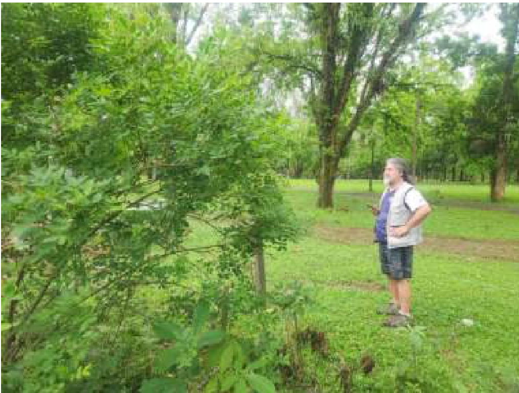
Fig. 19 : mudas com ótimo crescimento na área 2. 14/11/2023