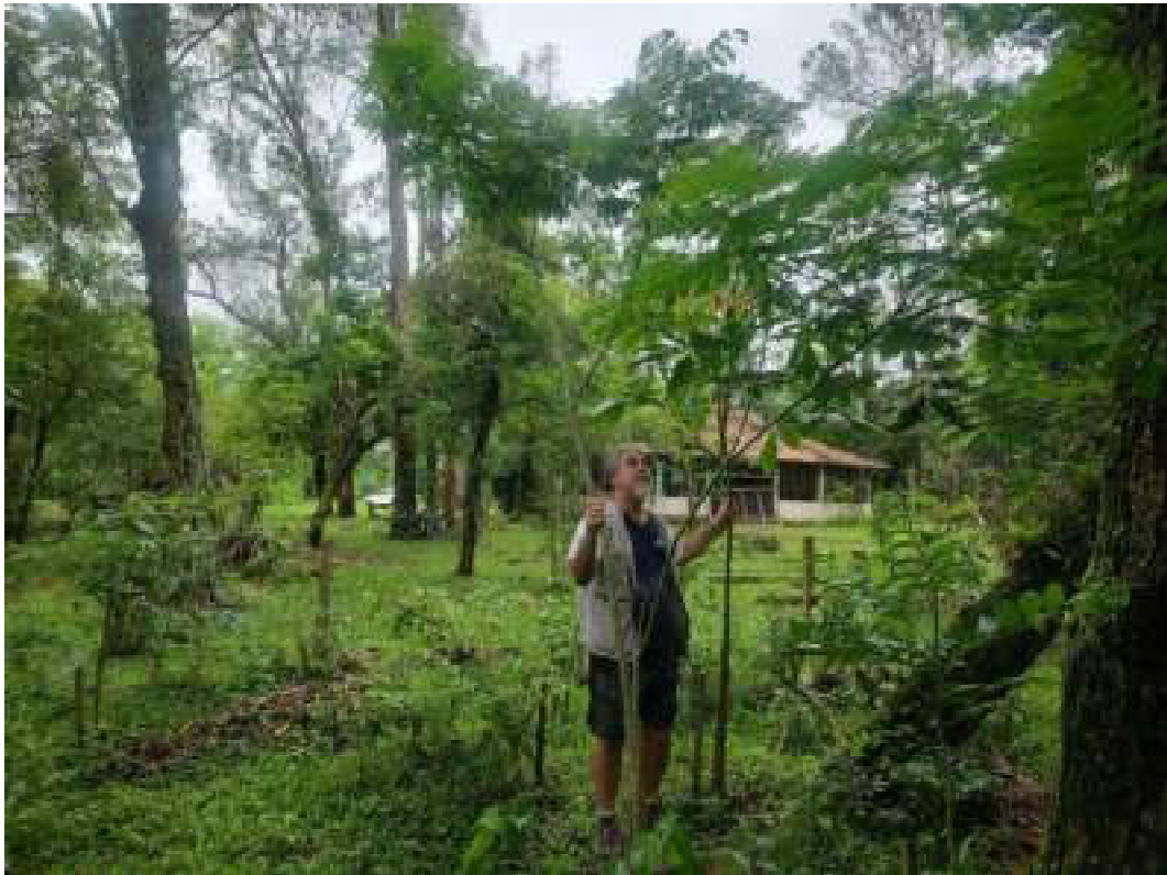
Fig. 7 : Alta taxa de sobrevivência e ótimo crescimento das mudas. 14/11/2023