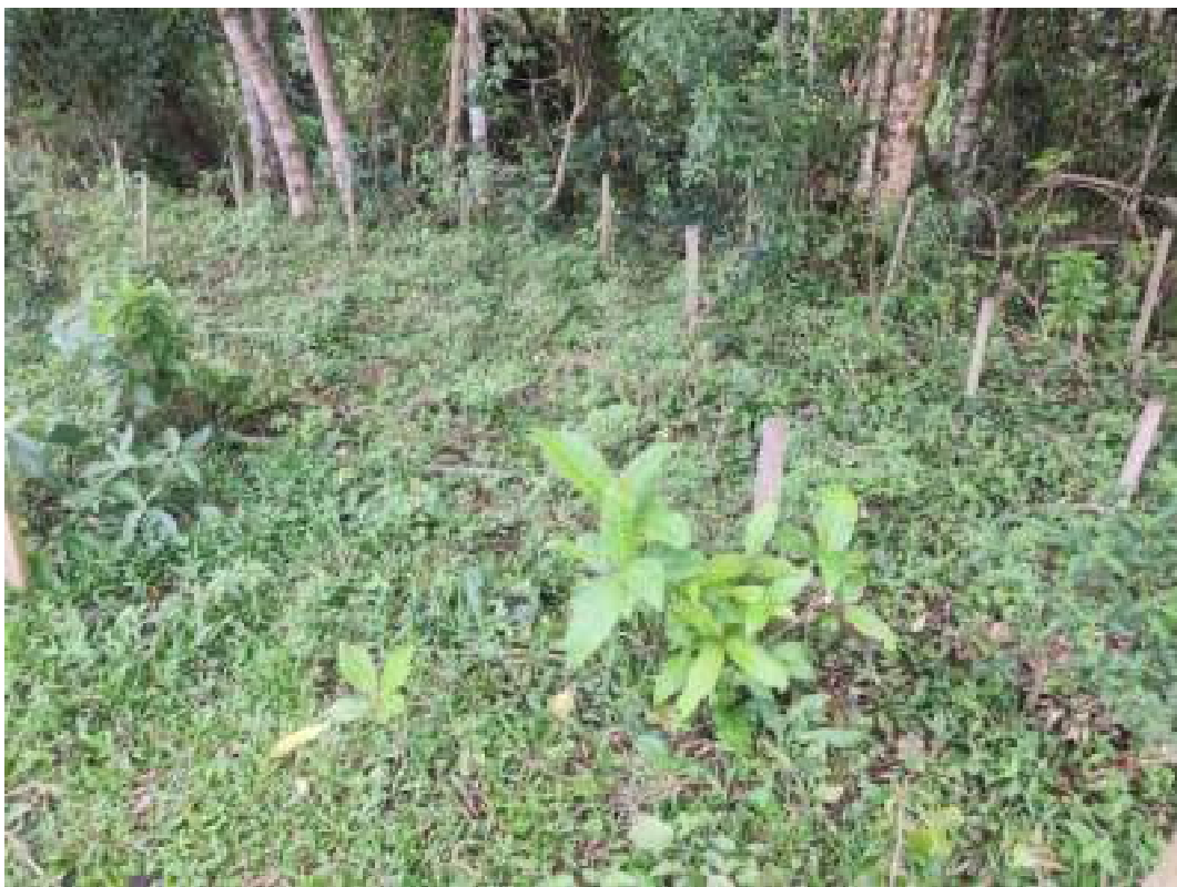
Fig 22: Área 3 Indivíduo de figueira ( Ficus cf cestrifolia ) se destacando em meio à indivíduos com marcas de herbivoria e pisoteio. 14/11/2023