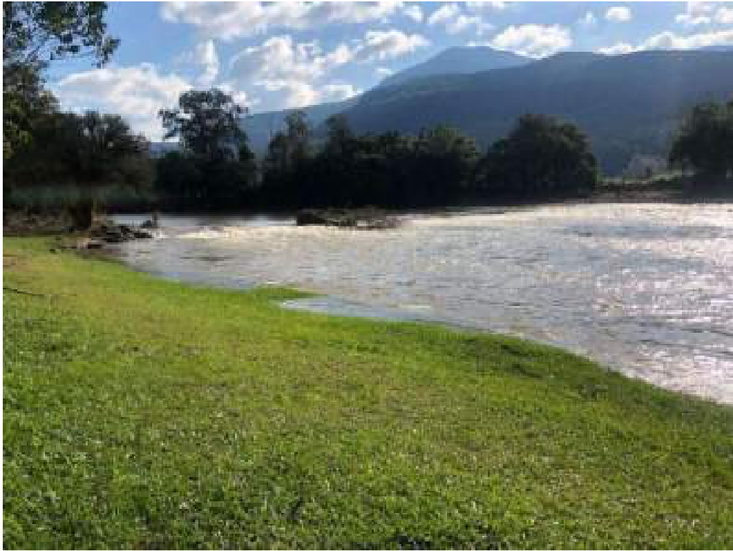
Fig. 6: enchente no rio Maquiné, após o ciclone de 15 de junho. Balneário Municipal. 18/06/2023