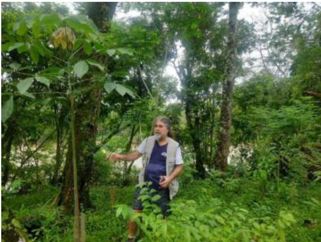
Fig 11. : Alta taxa de sobrevivência e ótimo crescimento das mudas, na área 1. 14/11/2023