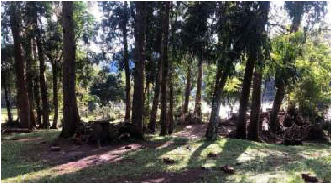
Fig.3: margem do rio Maquiné, com material trazido pela enchente do dia 15/06, no Balneário Municipal.

O monitoramento foi completado com registros fotográficos evidenciando os parâmetros avaliados.