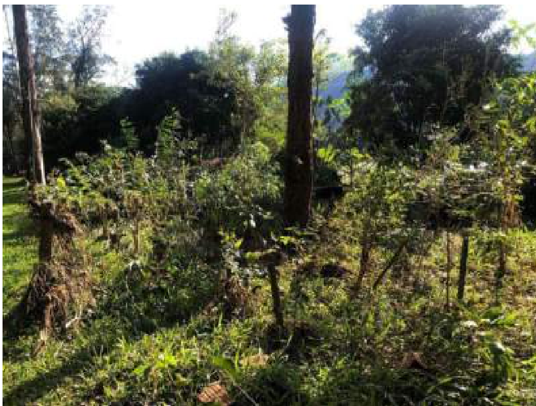
Fig. 4: cerca danificada após enchente provocada pelo ciclone, no Balneário Municipal. 18/06/2023