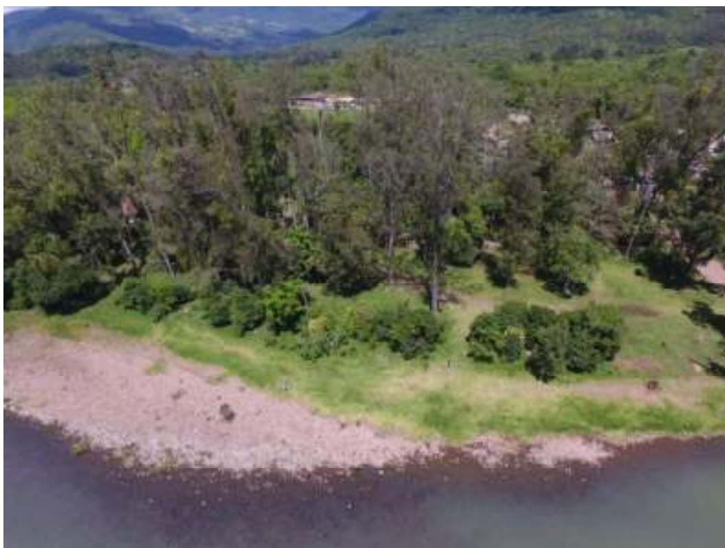
Fig. 9: Imagem aérea da margem mais à montante do Rio Maquiné, espaço destinado ao uso recreativo. 25/10/2022

Em termos do restabelecimento do ecossistema florestal observam-se aspectos importantes, como a presença de fauna e presença de regeneração natural (fig. 9-13).